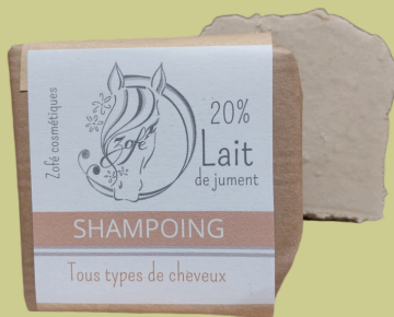
Tous types de cheveux

Pour un cuir chevelu en bonne santé, cela commence par un shampoing doux et sans produits controversés. Nos shampoings solides sont formulés dans cette optique