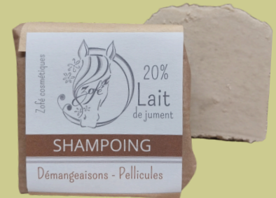
Démangeaisons et pellicules

20% de lait de jument, argile verte et huiles essentielles purifiantes (tea tree et lavandin) Parfait pour les cuirs chevelus regraisant vite. Il donne également des cheveux très doux