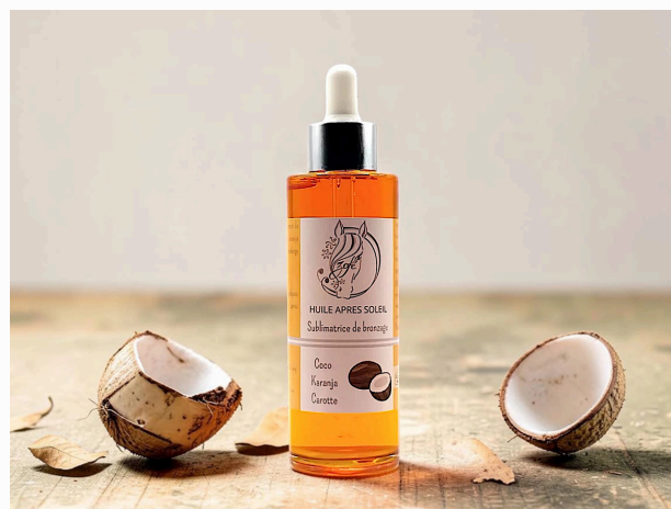
Sublimatrice de bronzage

Délicatement parfumée à l'huile essentielle d'orange douce. Va venir nourrir votre peau tout en laissant sa subtile senteur. Elle sera parfaite en application après épilation pour apaiser les peaux irritées